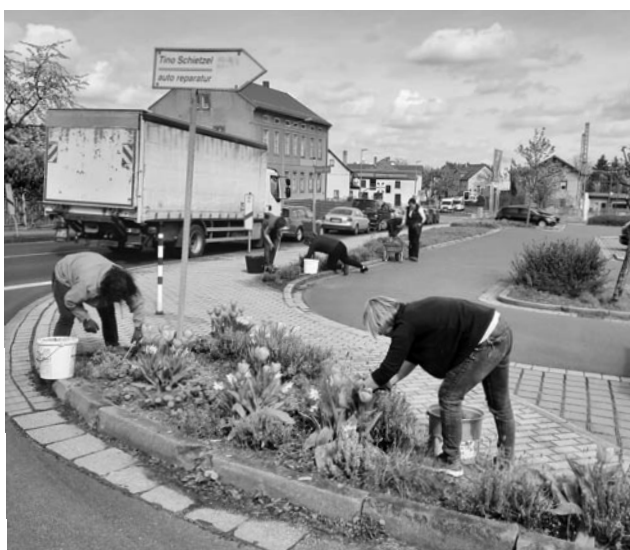
Einsatz Mitarbeiter der Gemeindeverwaltung an der Übergangsstelle Priestewitz

Um die aktuell akute Situation an den Grünflächen unserer Übergangsstelle in Priestewitz zu entschärfen, haben die Mitarbeiter der Gemeindeverwaltung am 05.04.2024 sowie am 12.04.2024 nach der regulären Arbeit ehrenamtlich einen Großeinsatz durchgeführt. Es wurde Müll eingesammelt, Unkraut beseitigt und Holzschnittel aufgebracht. Viele Mitarbeiter waren an beiden Tagen mehrere Stunden im Einsatz. Ein solcher ehrenamtlicher Einsatz ist nicht selbstverständlich! Vielen Dank dem gesamten Team dafür!