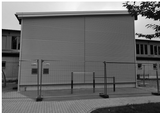
Gedämmte Fassade am Giebel der Sporthalle.

Mit dem Einbau neuer Fenster im Seitentrakt der Sporthalle wurde im November die Teilsanierung der Sporthalle in Priestewitz abgeschlossen. Im Zuge dieser Maßnahme konnten neben diesen Fensterarbeiten auch die Sanierung von Dusch- und Umkleieräumen, die Fassadendämmung am Giebel Richtung Strießener Straße sowie die Erneuerung der Spielfeldmarkierung durchgeführt werden.