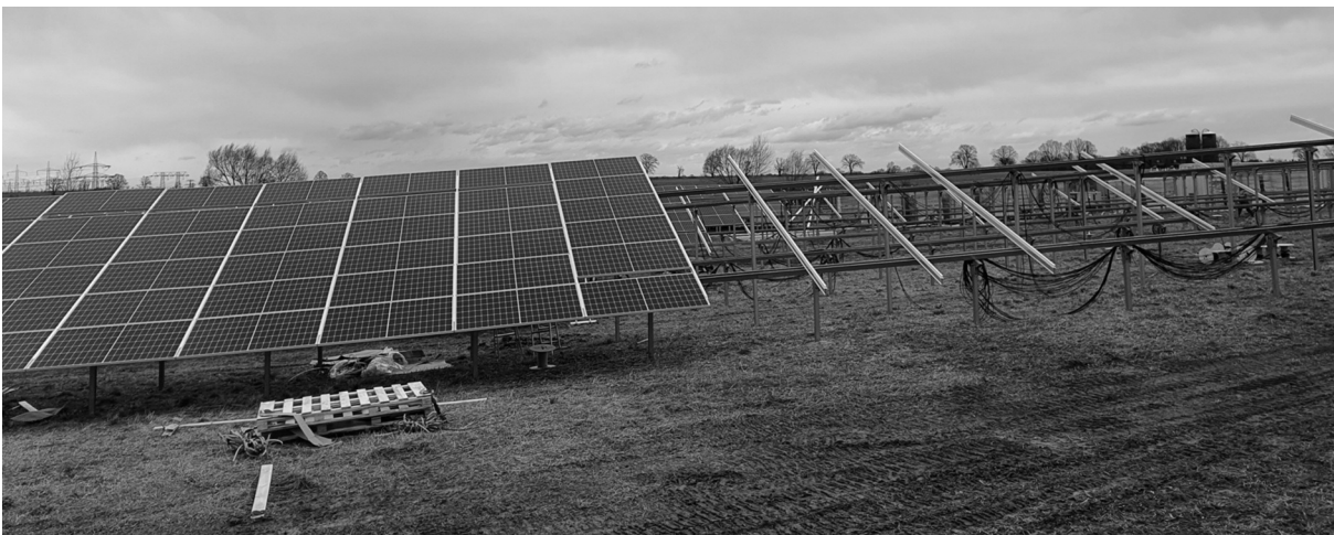
Aufbau Freiflächenphotovoltaikanlage in Medessen, Februar 2022

Ebenfalls Auswirkungen auf die „grüne Bilanz“ haben die vielen Solarflächen, welche unsere Bürger auf ihren Dächern installiert haben. Auch die Gemeinde Priestewitz hat mehrere Flächen für Freiflächenphotovoltaikanlagen ausgewiesen, so in Lenz ca. 2,6 ha, in Priestewitz ca. 2,2 ha und in Medessen ca. 12,9 ha. Dabei hat der Gemeinderat immer Acht gegeben, dass bei der Festlegung der Flächen ein ausreichender Abstand zur Wohnbebauung gegeben ist.